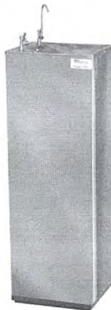
Bebedouro Industrial de Pressão R$ 890,00